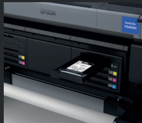
Sistema integrato con cartucce di inchiostro